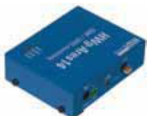
Hwg-Ares 12 plain