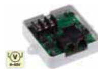
Датчик 60B 1Wire UNI