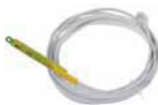
Датчик температуры Htemp-1Wire 3m