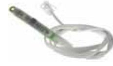
Датчик освещённости 1Wire UNI 3m