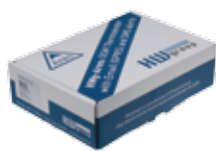
Hwg-Ares 12 Tset